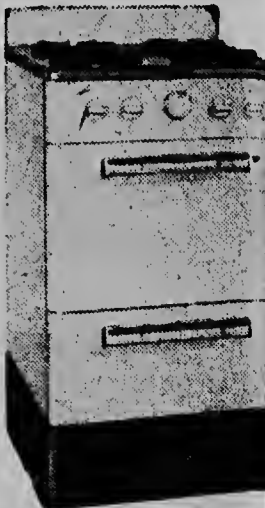
Model 670 I - f 200, — Model 670 II - f 235, —

PA MAS INFORME ACUDI NA IMPORTADOR S. N. ECURY N.V. ARUBA